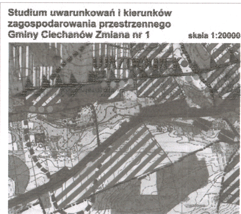
Studium uwarunkowań i kierunków zagospodarowania przestrzennego Gminy Ciechanów Zmiana nr 1 skala 1:20000

Załącznik nr 1 do Uchwały Nr XX/124/08 Rady Gminy Ciechanów z dnia 27 października 2008 r.