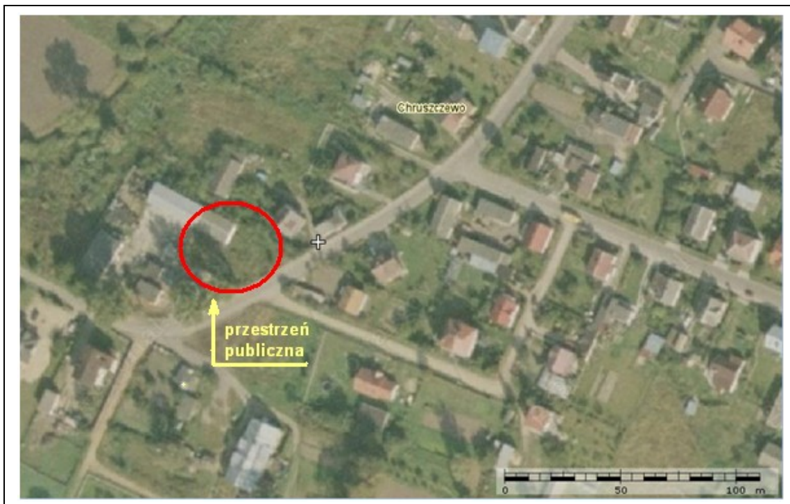
Rysunek 1. Przestrzeń publiczna w Chruszczewie

Remont świetlicy wiejskiej przyczyni się zatem do poprawy jakości życia mieszkańców miejscowości, poprzez stworzenie miejsca zapewniającego komfortowe warunki do spędzania wolnego czasu, co przyczyni się do integracji społeczności lokalnej oraz poprawy atrakcyjności miejscowości.